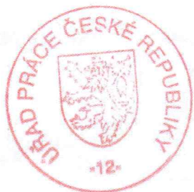
Mgr. Jiří Šimek

Podle ust. § 81 odst. 1 správního řádu, lze proti tomuto rozhodnutí podat odvolání k Ministerstvu práce a sociálních věcí, prostřednictvím Úřadu práce, u něhož se odvolání podává. Podle ust. § 83 odst. 1 správního řádu činí lhůta pro podání odvolání 15 dnů. Lhůta pro podání odvolání běží ode dne následujícího po doručení písemného vyhotovení rozhodnutí, nejpozději však po uplynutí desátého dne ode dne, kdy bylo nedoručené a uložené rozhodnutí připraveno k vyzvednutí.